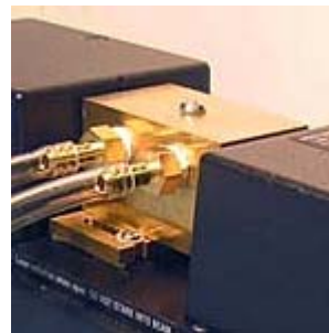
流通式试池 – Spectrex备有各种尺寸的流通式试池，并能按照用户的规格要求制造试池。还可以提供用于在高压和高温条件下试验用试池。