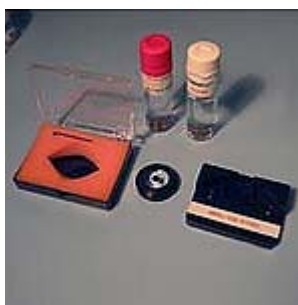
小指瓶附件—与5ml 指瓶或安瓿配用