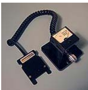
浑浊度计—快速测量与计算机计算有关的试样浑浊度