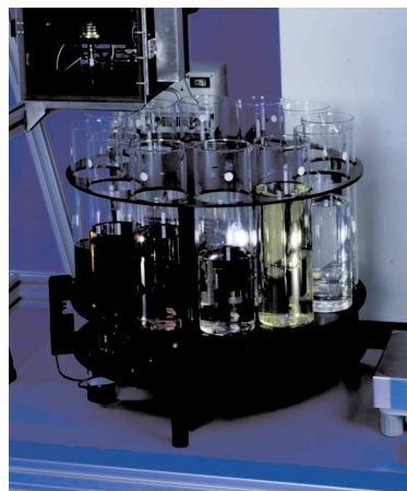
图二：自动分馏器发接收器

蒸馏原油在超过 200°C 时必须使用真空操作进行，本真空系统包括两段式真空泵，冷井，压力传感器，控制阀门及自动控制器。真空范围：100mmHg ~ 0.1mmHg.